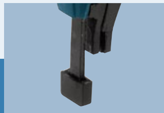
Work Piece Protection Protección de la pieza de trabajo