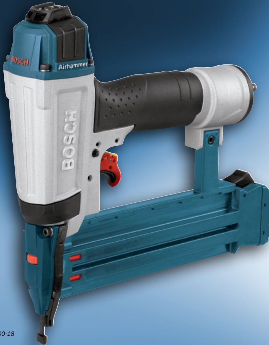
BNS200-18 shown Se muestra el modelo BNS200-18