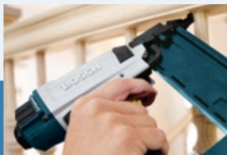
Precise Nail Placement Colocación precisa de los clavos